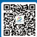
投资遂宁 官方微信公众号