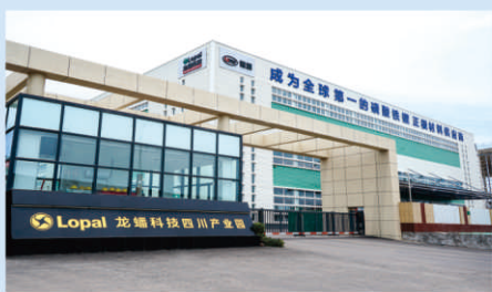
龙蟠科技四川产业园