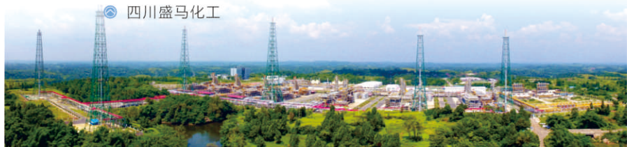
中石油磨溪天然气净化厂

遂宁构建“能源开采、储气调峰、就地转化”体系，聚集了中石油、盛马化工、美丰集团、苏博特等知名企业，天然气化工、石油炼化、盐卤提炼等全产业链基本形成。